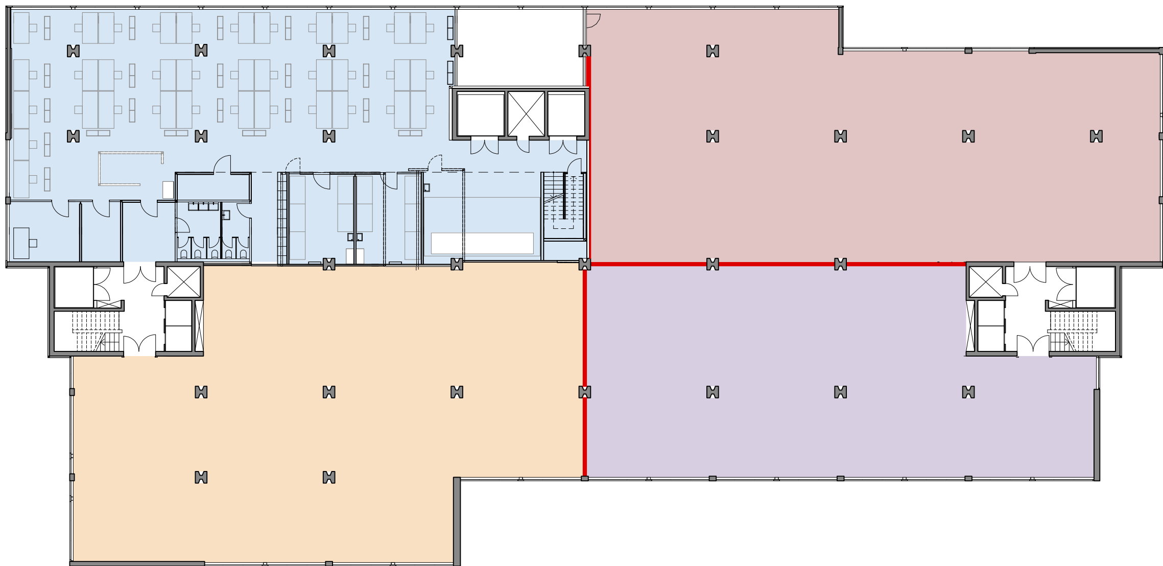
Grundriss 1. Obergeschoss, Variante 02