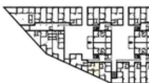
Übersicht 1. OG